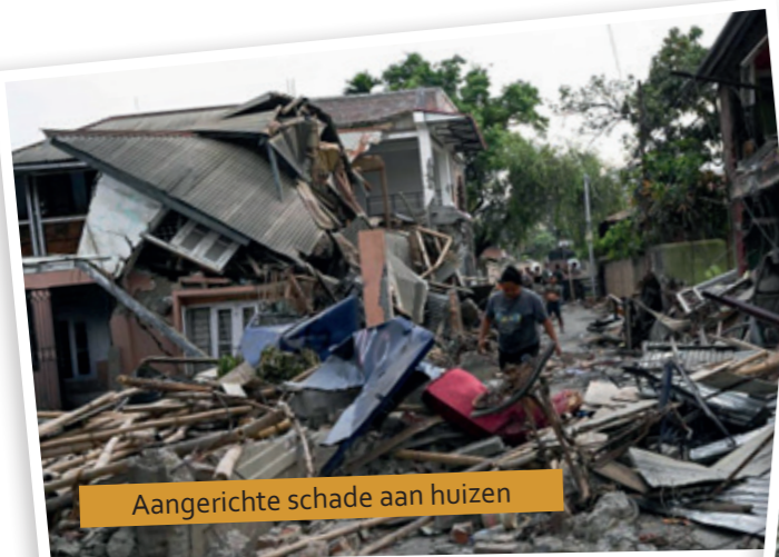
Aangerichte schade aan huizen