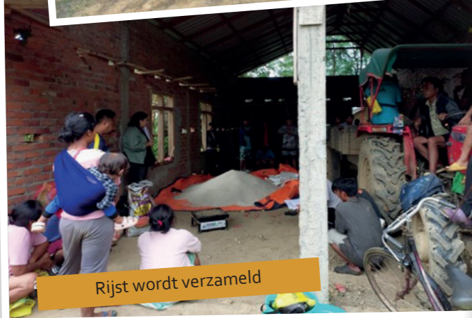
Rijst wordt verzameld