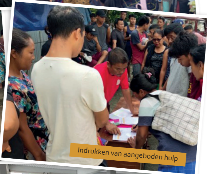
Indrukken van aangeboden hulp