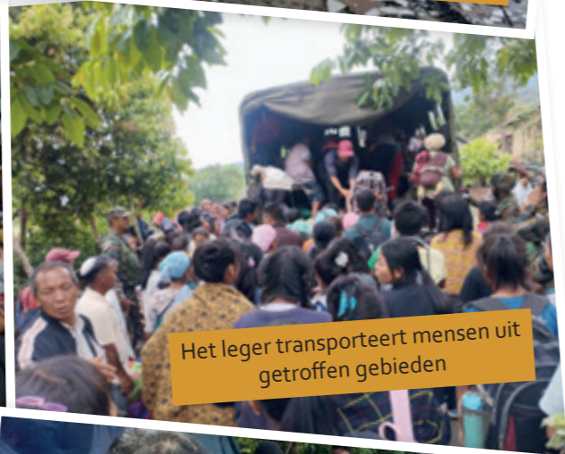
Het leger transporteert mensen uit getroffen gebieden