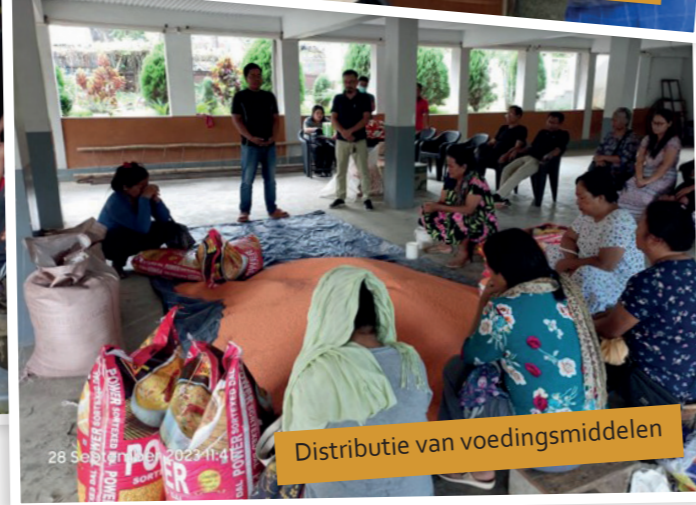
Distributie van voedingsmiddelen