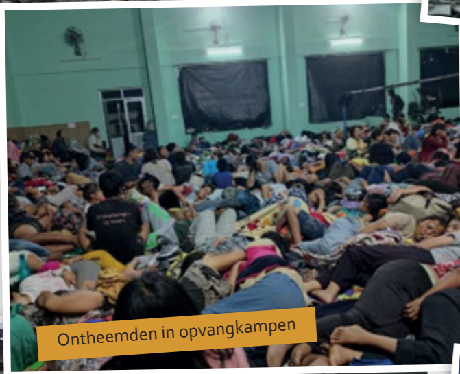
Ontheemden in opvangkampen