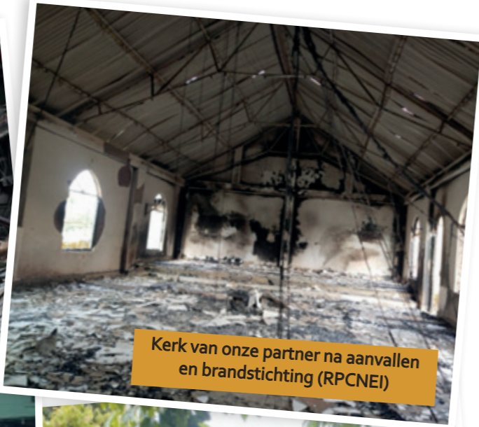
Kerk van onze partner na aanvallen en brandstichting (RPCNEI)