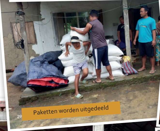
Pakketten worden uitgedeeld